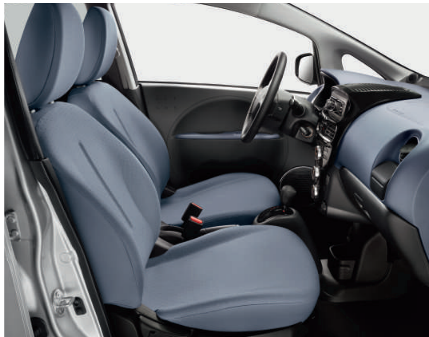
Tissu Parfait Knit Bleu